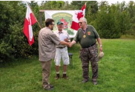
Moment wręczenia medalu po zakończonych zawodach na strzelnicy w Kanadzie!

Co kraj to obyczaj, stare międzynarodowe przysłowie? Ma ono rzeczywiście pokrycie z prawdą, szczególnie w tej przedstawionej tu dziedzinie łowieckiej. Myśliwy omijający strzelnice, traci walory zdecydowania i właściwej reakcji na występujące okoliczności i zdarzenia w przestrzeni łowieckiej.