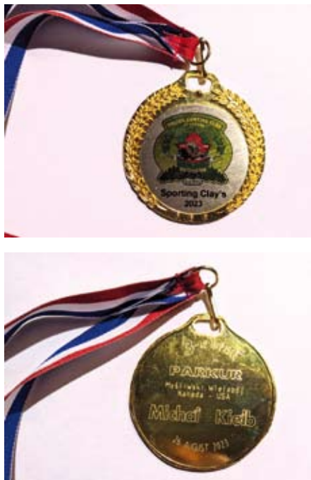
Rewers i awers zdobytego medalu za strzelanie myśliwskiej w konkurencji parkuru.